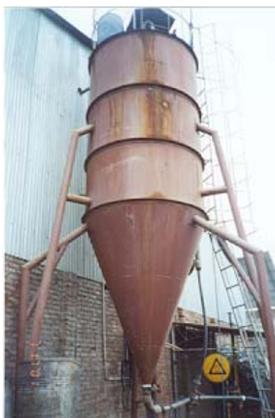
Figura 2. Decantador