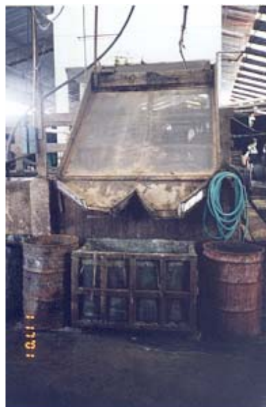
Figura 1. “Side hill”

12 y 13), a un tanque de oxidación de 9 m 3 de capacidad, previo paso a través de una malla inclinada (sidehill) para retener principalmente los lodos y el pelo extraído. En el tanque, los sulfuros son oxidados a sulfatos con burbujas de aire introducidas desde el fondo, en presencia de sulfato de manganeso que actúa como catalizador.