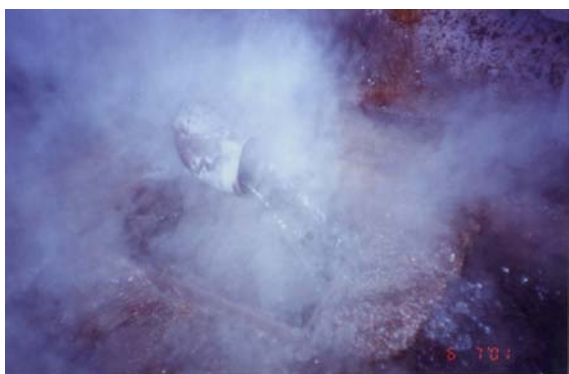
Figura 2 - Pérdidas de agua tratada (más vapor vivo) del sistema de enfriamiento de los hornos de reverbero antes de la implementación de la recomendación.