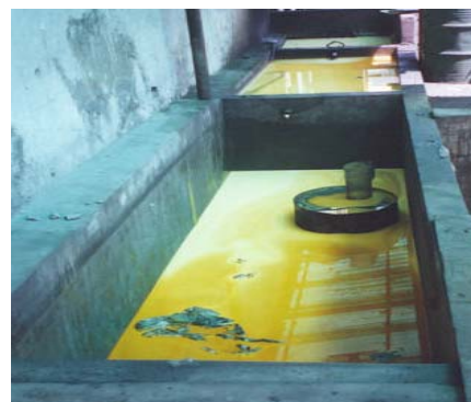
Figura 5 - Recuperación de aceites y grasas.

Actualmente, aceites y grasas, mezclados con agua, procedentes de los compresores de baja ley, se colectan en tanques de mampostería donde se produce la separación de fases, quedando finalmente una emulsión concentrada en ambos. Los tanques, 4 en total, están dispuestos en serie. El primero colecta la totalidad de las aguas que contienen aceites y grasas generados. A partir del segundo, se colectan los sobrenadantes, a fin de ir concentrando poco a poco los aceites y las grasas. El concentrado final es vendido a un precio de 100 US$/m 3 para la elaboración de lubricantes para automóviles.