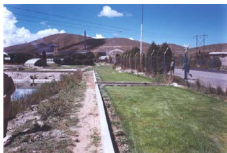
Figura 6 - Áreas verdes creadas en RBG

Se ha creado áreas verdes en el interior de los predios de RBG, específicamente alrededor de las lagunas de tratamiento, tanto de aguas residuales sanitarias como de las industriales.