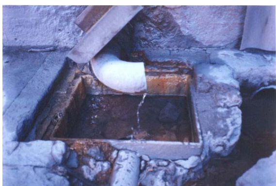
Figura 3 - Pérdidas de agua tratada del sistema de enfriamiento de los hornos de reverbero después de la implementación de la recomendación.

Asimismo, se ha disminuido la frecuencia de regeneración de las resinas de intercambio de la planta de tratamiento de agua, de 1 ciclo cada 2.4 días a 1 ciclo cada 4.4 días, lo que a su vez ha incidido en la reducción de alrededor de 12,900 kg/año en el consumo de ácido sulfúrico (reactivo químico utilizado para la regeneración de las resinas catiónicas), y de 4,500 kg/año en el consumo de soda cáustica (empleada para la regeneración de las resinas aniónicas).