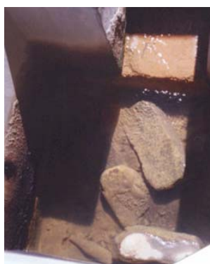
Figura 4 - Agua residual que sale de la laguna industrial.

Finalmente, se ha logrado reducir en 26% la descarga de aguas residuales industriales que, junto con la recuperación de aceites y grasas (ver la siguiente recomendación) ha permitido incrementar la eficiencia de la laguna de sedimentación que trata el efluente industrial (en la Figura 4 se puede apreciar la transparencia con la que ahora sale el agua residual de la laguna).