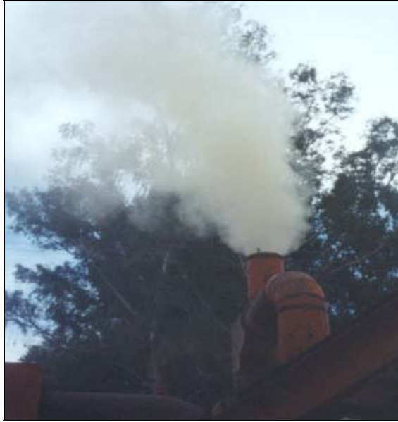
Figura 2 - Emisión de polvo a la atmósfera antes de la implementación de la recomendación.

La Asfaltadora compraba agregados pétreos de la empresa Erika y extraía áridos finos del Río Guadalquivir. Éstos últimos no eran sometidos a ningún tipo de clasificación o procesamiento por lo que la cantidad de polvo (material fino) contenido en éstos era considerable, lo que producía una emisión notoria de polvos a la atmósfera (ver Figura 2) y un elevado consumo de cemento asfáltico.