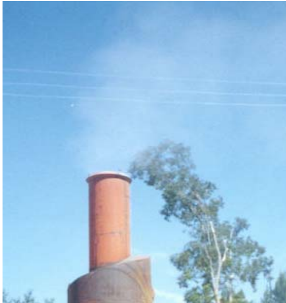
Figura 3 - Emisión de polvo a la atmósfera luego de la implementación de la recomendación.

Situación actual. Cantidad de polvo emitida a la atmósfera: 3.3 kg de polvo/t de mezcla asfáltica. Consumo de cemento asfáltico: 79.4 L/m 3 de mezcla asfáltica.