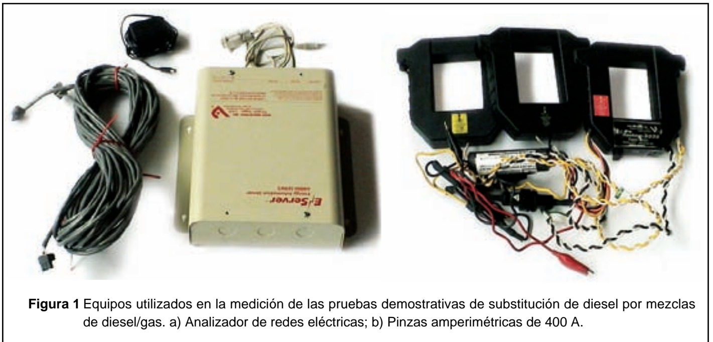
Figura 1 Equipos utilizados en la medición de las pruebas demostrativas de sustitución de diesel por mezclas de diesel/gas. a) Analizador de redes eléctricas; b) Pinzas amperimétricas de 400 A.

Desde el punto de vista económico, la sustitución de diesel por gas natural, representa un ahorro económico para las