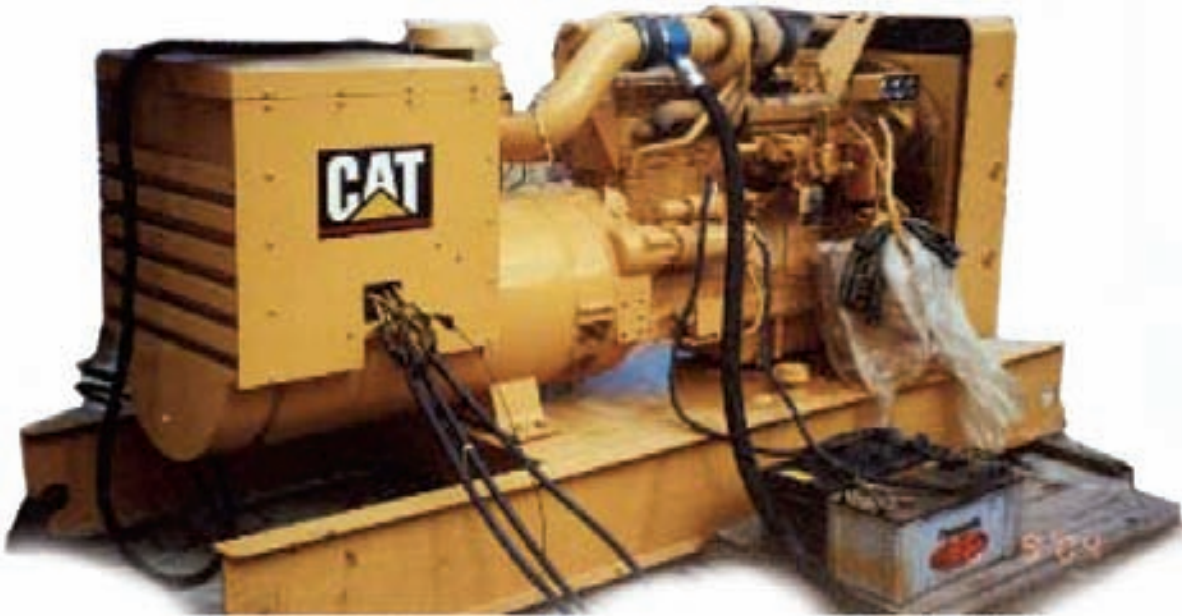
Figura 2. Grupo electrógeno empleado en las demostraciones de sustitución parcial de diesel por gas natural